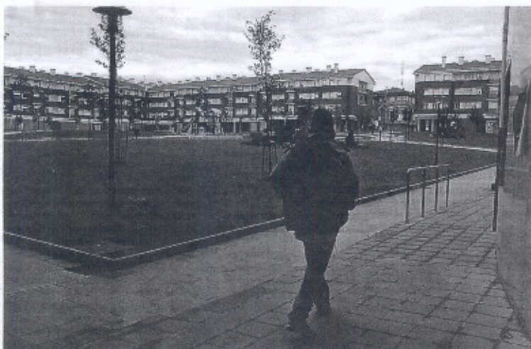
Una persona pasa por la plaza de un complejo de viviendas de nueva construcción en Zamudio. Jose Sampedro

Recordó que el Plan foral se puso en marcha en 2003 «defi-